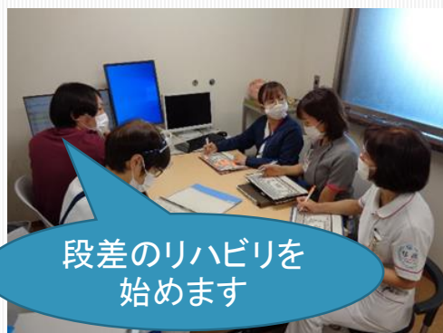
多職種カンファレンス

退院支援では、退院後は住み慣れた地域で生活できるように、状態に合わせた在宅サービスなど提案しています。必要な場合は、退院前・退院後に患者さんの自宅を訪問し、家屋を確認、安心して在宅療養が送れるように地域のスタッフと連携をとりながら支援しています。また、退院先はご自宅以外にも患者さんの状態を確認し、他院や施設への調整も行います。