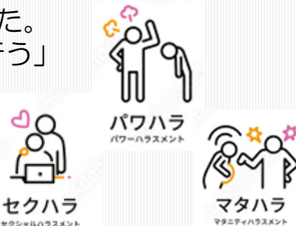
セクハラ セクシャルハラスメント

価値観や個人の考えに違いがある事を十分に理解し、対応することが大切であると学びました。これらを踏まえ、職員全体の伝達講習頑張ります。